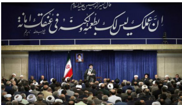
ره ایران پس از انتخابات، در خ ل سخ انی ۲۱ خرداد برای کارگزاران نهادهای مختلف جمهوری اس می

تحت فشار قرار میدهد که برای رضایت عالیترین مقام کشور، فضای اینترنت ایران را به دقت رصد کند. تحولات علیه بیطرفی شبکه (net neutrality) که در ادامه درباره آن بحث خواهیم کرد، بیشتر در مورد نگرانیها در مورد آزادی بیان و دسترسی به اطلاعات است.