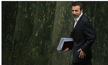
محمود واعظی در جلسه علنی مجلس ۱۶ خرداد ۱۳۹۶

وزیر ارتباطات ایران توضیح نداده که چرا سانسور شدید در ایران ادامه داشته است. او همچنین هیچ توضیحی درباره اینکه کدام پلتفرم‌ها به عنوان پالایش هوشمند مورد هدف قرار گرفته‌اند، ارائه نداده است. وزیر ارتباطات ایران پیش از این نیز به فرآیند احتمالا مشابهی از فیلترینگ هوشمند اشاره کرده بود، که به نظر می‌رسد تنها در مورد اینستاگرام اجرا شده است. مشکلات فنی و همچنین نگرانی‌هایی که درباره آزادی بیان با این نوع سانسور «هوشمند» وجود دارد، در آخرین مقاله ما با عنوان «محدود کردن شبکه» (tightening the net) مورد بحث قرار گرفته است ۶ .