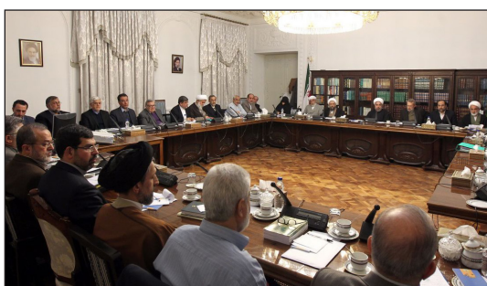
تصویر: از نشست شورای عالی انقلاب فرهنگی

یک هفته قبل از انتخابات در ۱۸ اردیبهشت و در هفتادمین نشست شورای عالی انقلاب فرهنگی، یکی از اعضای شورای عالی فضای مجازی، بحثی در مورد «پیوست فرهنگی اپراتورهای تلفن همراه» مطرح کرد که شامل فرصت‌ها و تهدیدهای دسترسی کاربران به پیام‌های صوتی و تصویری نرم افزارها می‌شد. هنوز مشخص نیست که شورای عالی فضای مجازی «پیوست فرهنگی اپراتورهای تلفن همراه» را به عنوان قانون تصویب خواهد کرد یا نه. اما اگر این لایحه به عنوان قانون تصویب شود، قوه قضاییه هیچ انتخاب دیگری نخواهد داشت و باید آن را به عنوان یک قانون اجرا کند ۵ . واضح است که هدف چنین راهنمایی، کنترل و نظارت بیشتر بر آزادی بیان و دسترسی به اطلاعات بر روی گوشی‌های موبایل است. این مساله از آن رو مهم است که بیش از نیمی از ایرانیان از طریق گوشی‌های تلفن همراه‌شان به اینترنت وصل می‌شوند ۶ .