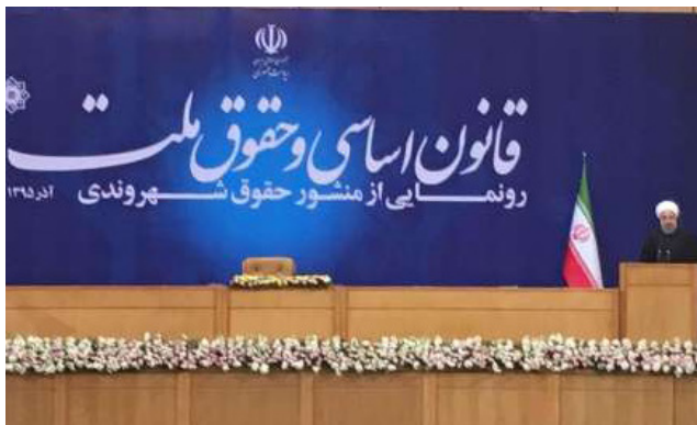
روحانی با رونمایی از منشور حقوق شهروندی در آذر ۱۳۹۵ به یکی از وعده‌های انتخاباتی خود عمل کرد.

ماده ۲۶: هر شهروندی از حق آزادی بیان برخوردار است. این حق باید در چهارچوب حدود مقرر در قانون اعمال شود. شهروندان حق دارند نظرات و اطلاعات راجع به موضوعات مختلف را با استفاده از وسایل ارتباطی آزادانه جست‌وجو، دریافت و منتشر کنند. دولت باید آزادی بیان را به طور خاص در عرصه‌های ارتباطات گروهی و اجتماعی و فضای مجازی از جمله روزنامه، مجله، کتاب، سینما، رادیو، تلویزیون و شبکه‌های اجتماعی و مانند اینها طبق قوانین تضمین کند.